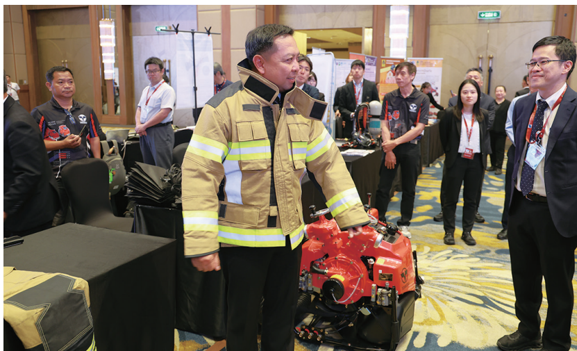
防火衣の着装体験をするタイ内務省災害防止軽減局ティラバット・カチャマット局長