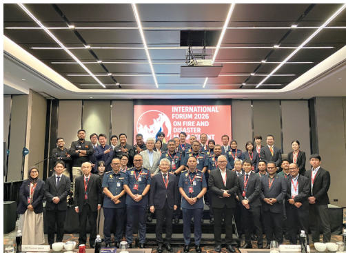
マレーシアフォーラム参加者との記念撮影