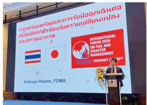
セッション「気候変動関連災害への備えと緊急対応」

火災のリスクや火災による死者は減少傾向にある一方で、地震・津波時の大規模火災や木造密集地の火災リスクは依然存在している現状が伝えられました。さらに、高齢化に伴い住宅