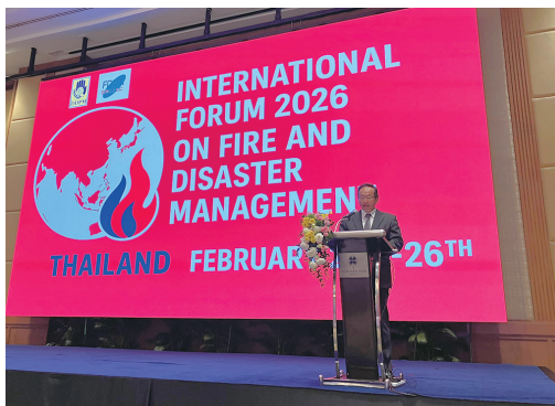
オープニングセレモニーでスピーチを行う大鷹大使

オープニングセレモニーでは、両国の代表からのスピーチが行われ、日本側は、在タイ大使館の大鷹大使より、「日・タイが知識・技術を共有し、実効性ある協力を通じて消防防災体制を