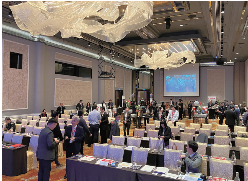
シンガポール会場全景

衛隊(SCDF)を含む約100名、1月14日のフォーラムには、マレーシア側参加者であるマレーシ