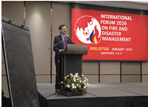
オープニングセレモニーでスピーチを行う四方大使