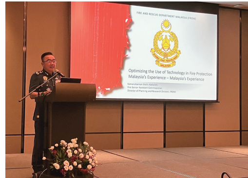
マレーシア消防救助隊カマルザマン・マリク・アブドゥラ上級次席コミッショナーによる講演『消防防災における技術活用の最適化～マレーシアの経験～』