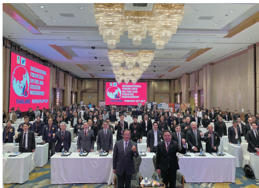
タイフォーラム参加者との記念撮影