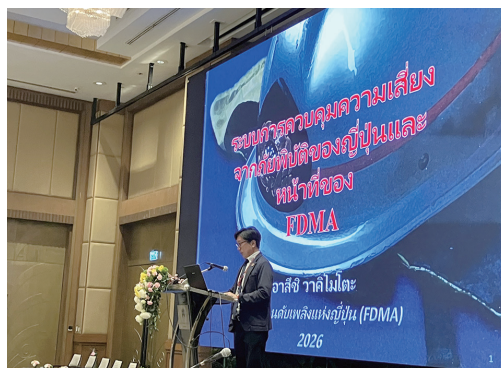
セッション「消防庁の災害対応」

火災の死者リスクは低減せず、近年増加傾向にある中で、リチウムイオン電池やバイオマス、大規模倉庫の火災など新たな課題も生じており、国際的な協力による対策の重要性の高まりが強調されました。