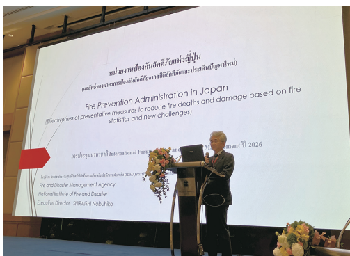
セッション「日本の火災予防行政～火災統計からみた火災死者・被害の低減施策の効果と今後の課題～」